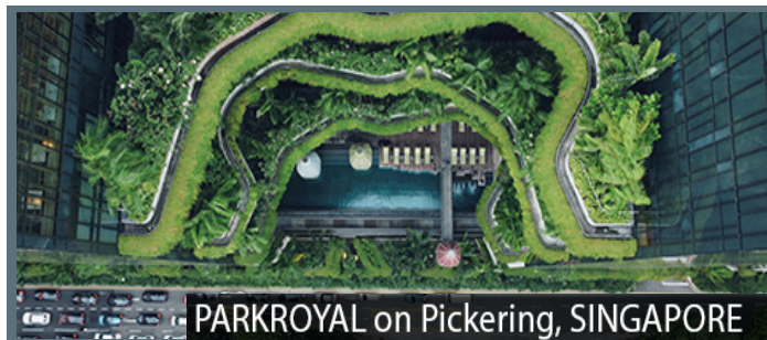
PARKROYAL on Pickering, SINGAPORE